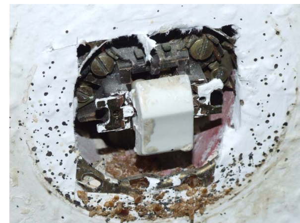
Bettwanzenversteck hinter einem Lichtschalter

Hinweise zum Aussehen und zur Lebensweise von Bettwanzen finden Sie unter http://www.biozid.info .