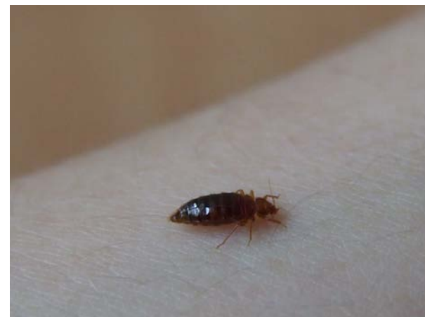
Bettwanze beim Blutsaugen

Die Wahrscheinlichkeit, sich Bettwanzen mitzunehmen, hängt in erster Linie von der Stärke des Befalls und der Dauer des Aufenthalts vor Ort ab.