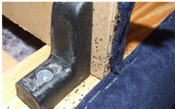
Typische Bettwanzenspuren am Bett

Stark befallene Möbelstücke wie Polsterliegen, Matratzen oder Kinderbetten, bei denen eine intensive und großflächige Behandlung mit einem Insektizid notwendig ist, sollten anschließend aus Gründen des vorbeugenden Gesundheitsschutzes entsorgt werden. Sie müssen mit Plastikfolie dicht verpackt werden, damit ggf. noch lebende Tiere nicht entkommen können. Im optimalen Fall sollte die Entsorgung durch den Schädlingsbekämpfer erfolgen. Wischen Sie die vom Schädlingsbekämpfer gezielt ausgebrachten Insektizide nicht weg, da diese auf Grund ihrer Langzeitwirkung noch auf herumlaufende Wanzen wirken. Reinigen Sie nur Gebrauchsoberflächen oder Hautkontaktstellen wie Tische und Ablagen einige Stunden nach der Ausbringung. Babys und Kinder im Krabbelalter sollten sich möglichst nicht in mit Insektizid behandelten Räumen aufhalten. Beachten Sie die Sicherheitshinweise des Schädlingsbekämpfers.