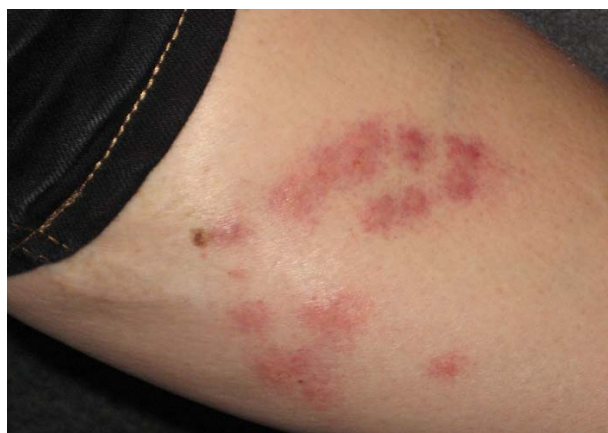
Bettwanzenstiche am Bein

Rufen Sie einen Schädlingsbekämpfer an und lassen Sie sich von ihm beraten. Vergleichen Sie die Beratung mit dieser Hinweisbroschüre und Aussagen anderer Schädlingsbekämpfer.